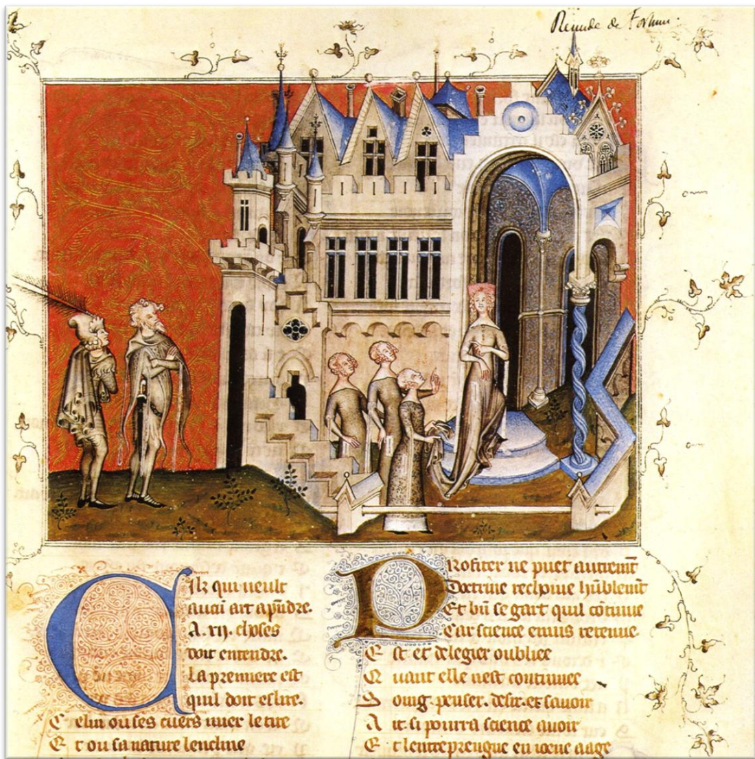
Guillaume de Machaut – Le Remède de Fortune (recueil de Poésies – Paris BnF)