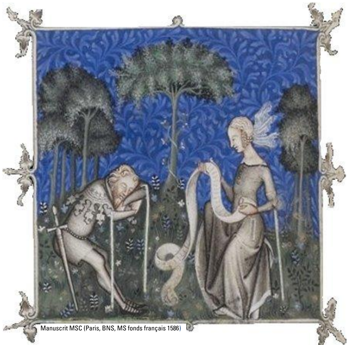
Manuscrit MSC (Paris, BNS, MS fonds français 1586)