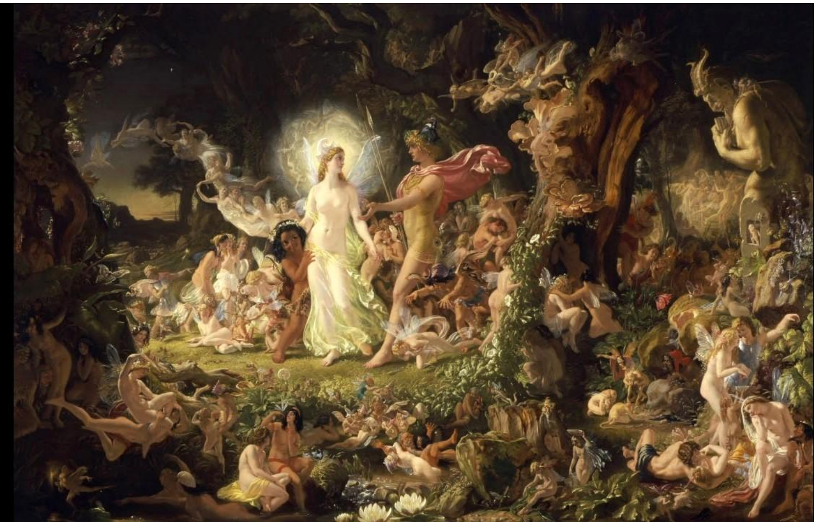
La Querelle d'Obéron et Titania (Le Songe d'une Nuit d'Été) 1849 – Sir Joseph Noël Paton – National Gallery of Scotland