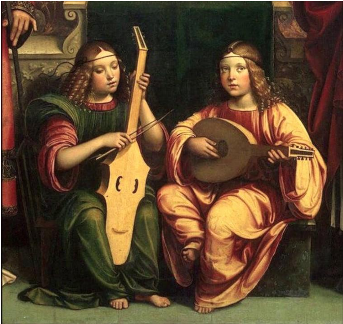
La Vierge et l'Enfant (détail, vers 1500) – Francesco Francia – Musée de l'Hermitage