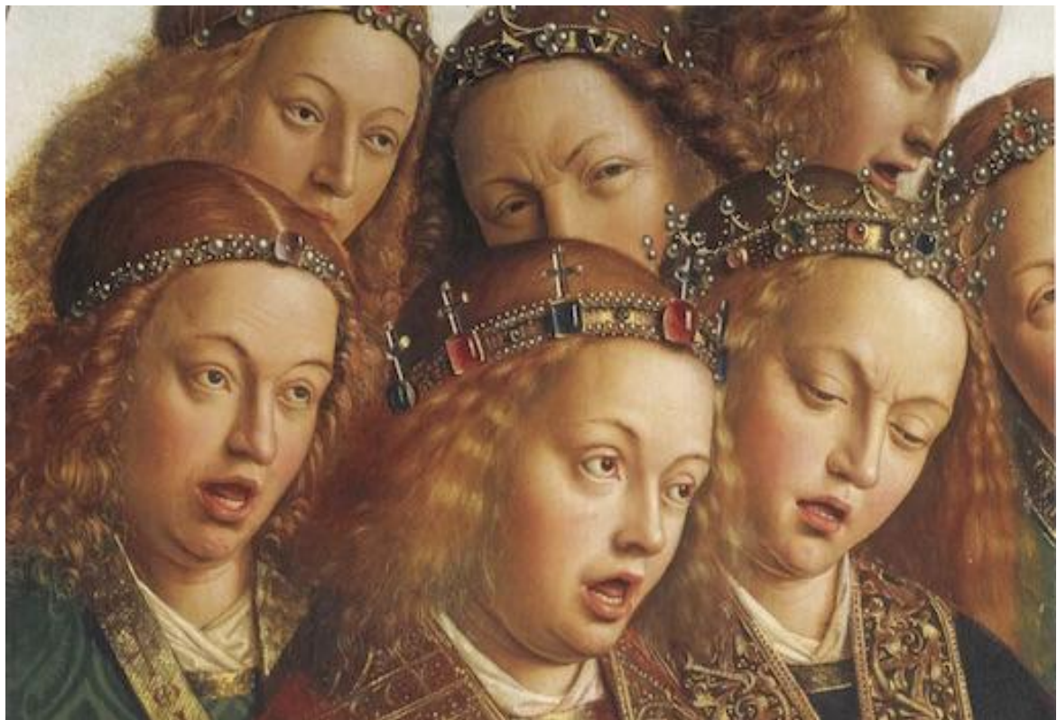
Le Choeur des Anges (détail) – Jan van Eyck (15 ème )

A cette messe, le programme musical joint un certain nombre de motets, comme pour composer une liturgie idéale.