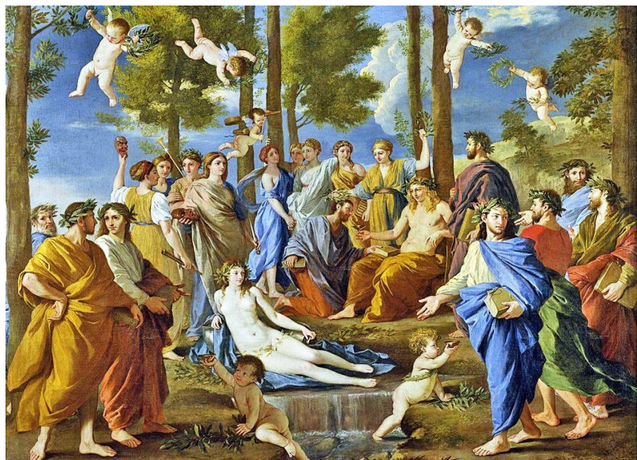
Apollon et les Muses - Le Parnasse (vers 1630-1631) – Nicolas Poussin (Prado)