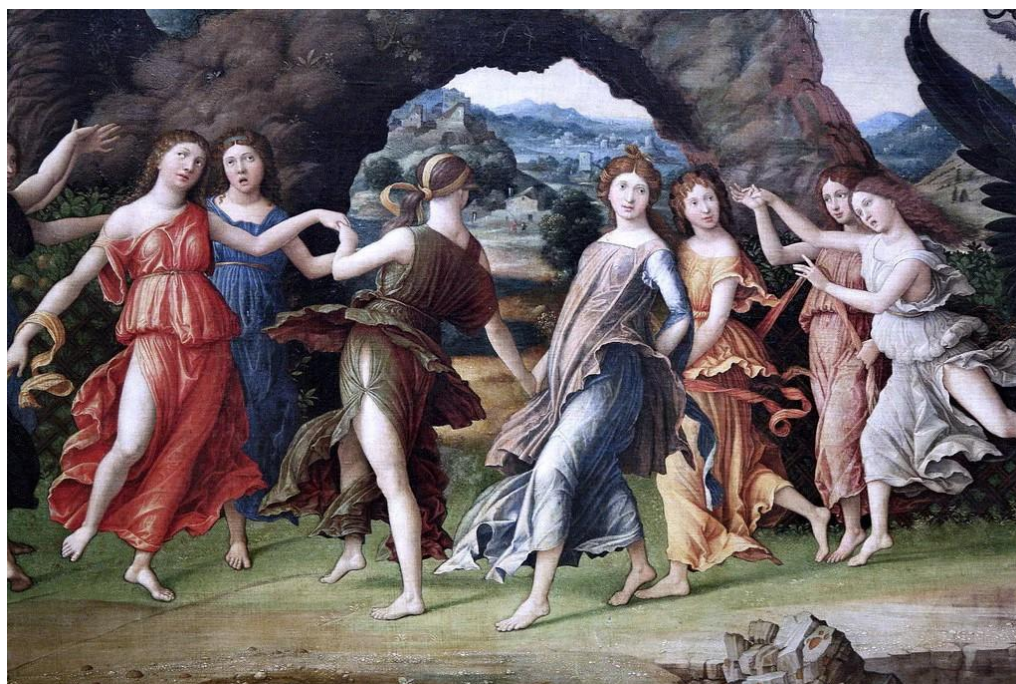
Le Parnasse (détail) – Andrea Mantegna (1497) – Le Louvre

A Salzbourg, à partir des années 1670, deux immenses violonistes rivalisent de virtuosité et de créativité, et se font les spécialistes de cette musique descriptive. La fameuse Bataille de Biber est passée à la postérité, mais son aîné Schmelzer fait également preuve de beaucoup d'esprit dans sa suite mettant en scène une école d'escrime, avec de savoureux passages illustrant les entraînements des apprentis bretteurs.