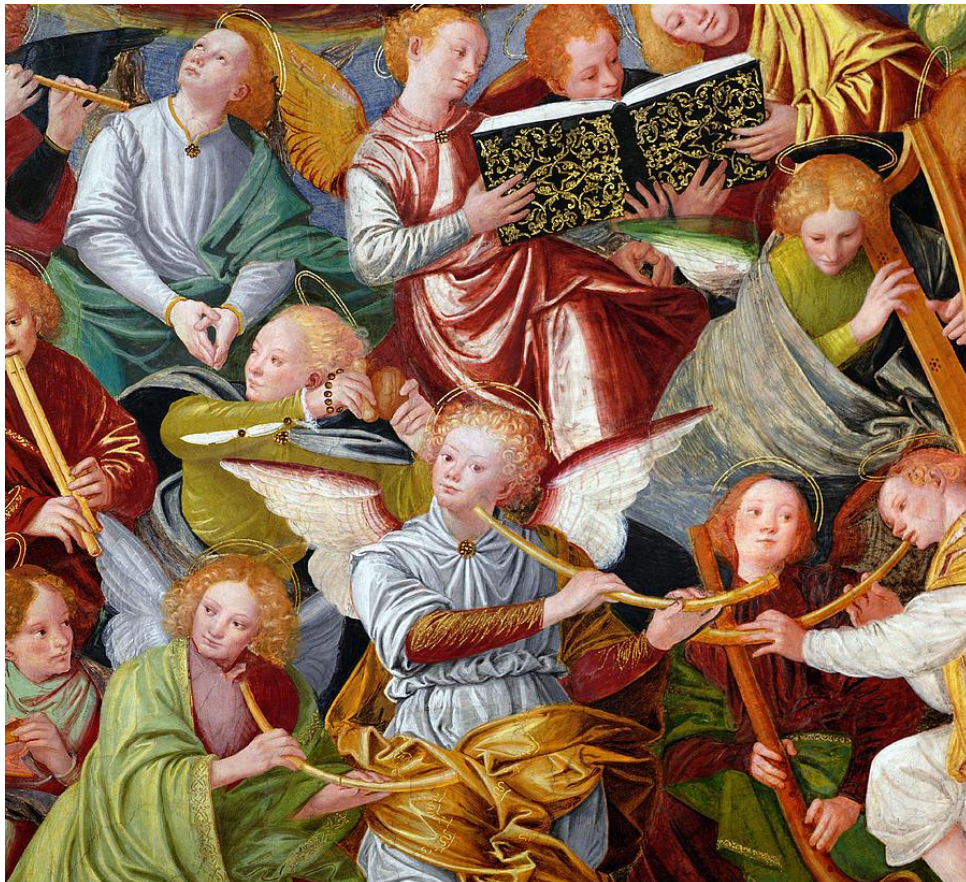
Le Concert des Anges (détail) - Gaudenzio Ferrari (vers 1534-1536)