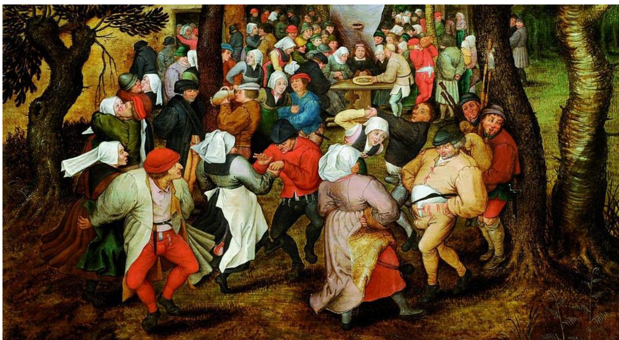
Pieter Breughel le Jeune (1620) – Danse de mariage

saqueboute, de la trompette, du cromorne, de la flûte traversière et de la flûte à bec et semble avoir participé aux offices du soir de la Confrérie.