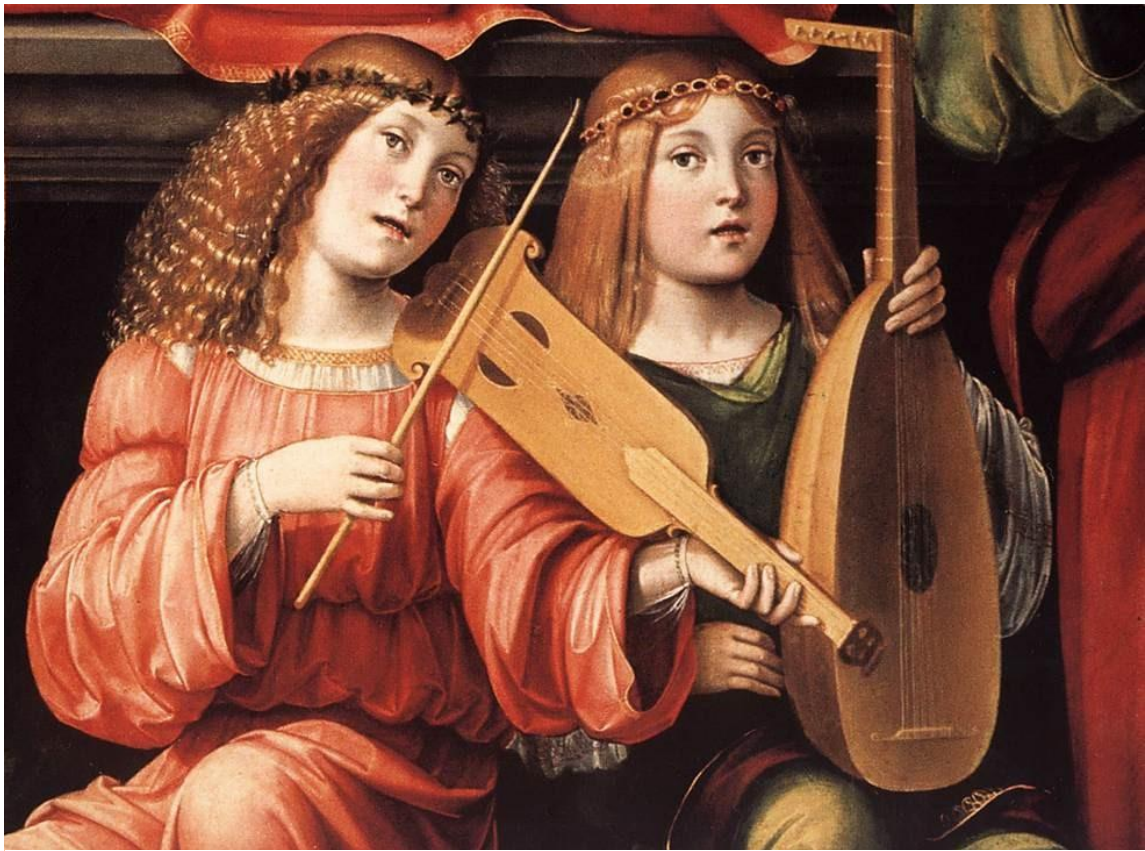
Madonna e santi (détail, vers 1500) – Francesco Francia – Collection San Giacomo Maggiore, Bologne