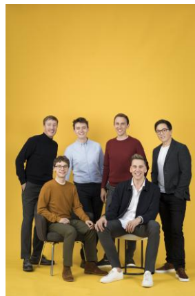
The King's Singers