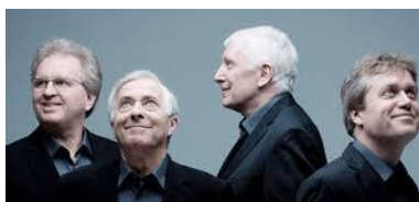
The Hilliard Ensemble