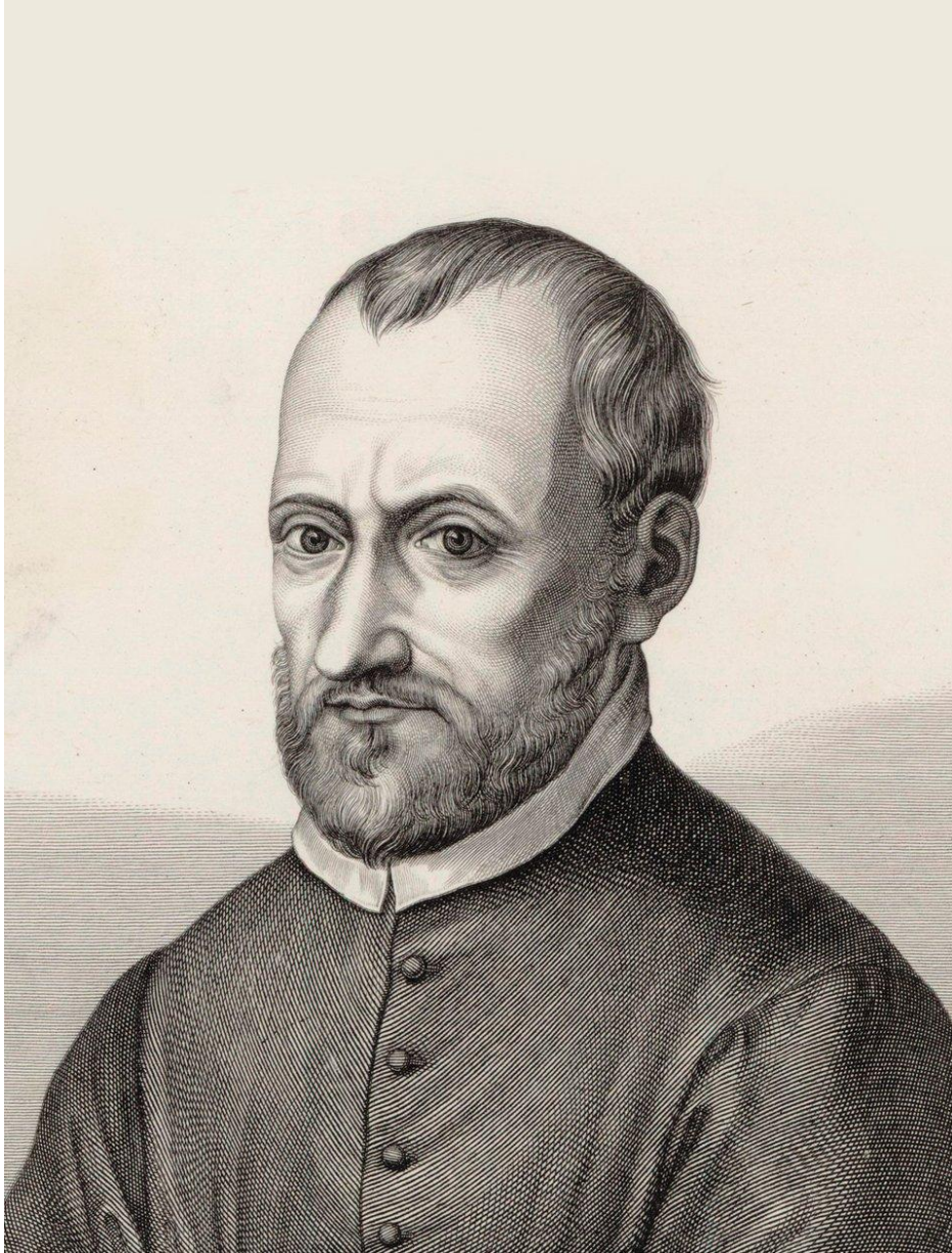
Giovanni Pierluigi da Palestrina